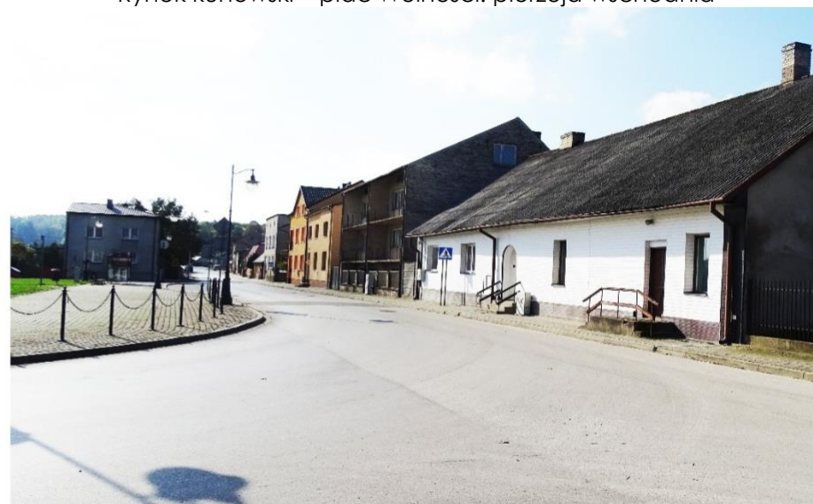
Rynek kunowski – plac Wolności: pierzeja zachodnia