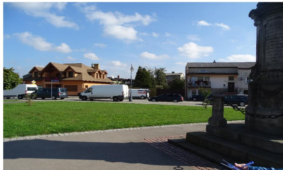
Rynek kunowski – plac Wolności: pierzeja wschodnia